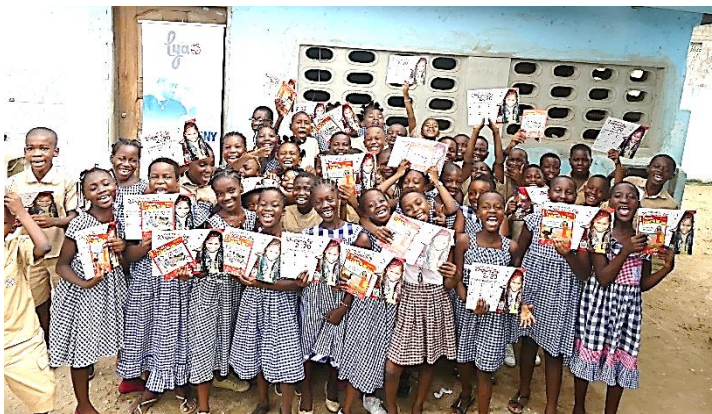
Figure 4: Les élèves des classes de CM1 et CM2 du GS Arc-en-Ciel après la sensibilisation

Résultat attendu : Environ 2500 élèves des classes de CM et 100 encadreurs ont une meilleure connaissance de la drépanocytose, de ses facteurs déclenchants et de ses méthodes de prévention.