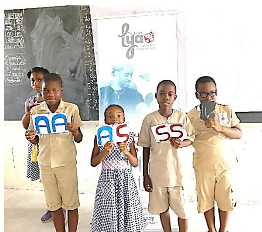
Figure 5: Jeu de rôle avec les apprenants sur la transmission de la maladie

Au terme de cette phase de sensibilisation, les écoles compétitrices se retrouveront le 19 juin 2020 pour la cérémonie de remise des prix du concours de slogan, de logo et de slam à l'occasion des célébrations de la journée mondiale de la lutte contre la drépanocytose. A cet effet, les préparatifs ont débuté par la recherche de salle pouvant accueillir les festivités et des courriers ont été adressés aux différents partenaires financiers et institutionnels.